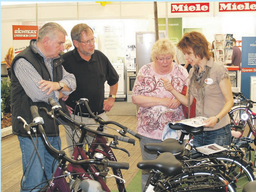
Für persönliche und informative Gespräche stehen die Aussteller jederzeit gerne zur Verfügung.