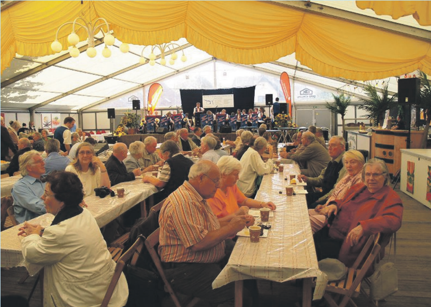
Auch in diesem Jahr ist wieder für eine abwechslungsreiche Unterhaltung sowie für das leibliche Wohl gesorgt.