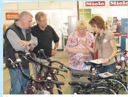
Für persönliche und informative Gespräche stehen die Aussteller jederzeit gerne zur Verfügung.