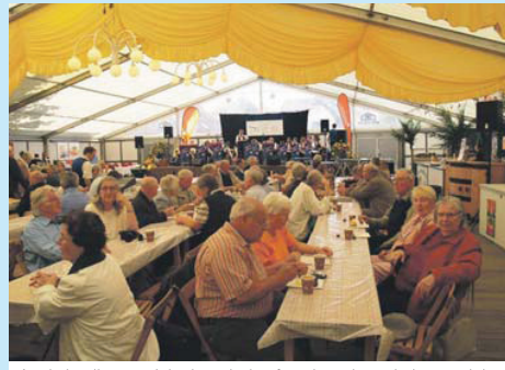
Auch in diesem Jahr ist wieder für eine abwechslungsreiche Unterhaltung sowie für das leibliche Wohl gesorgt.