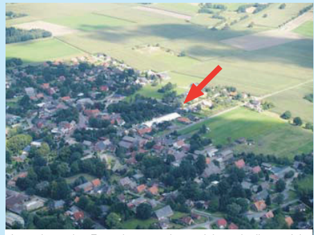
In und um das Festzelt präsentieren sich auch dieses Jahr wieder zahlreiche Aussteller mit vielfältigen Angeboten.

Zusammen weiter gehen – Wannauer Zukunftstage – Wohnen – Leben – Arbeiten